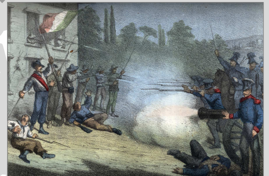
Assalto alla casa di Ciro Menotti la notte del 3. febbrajo 1831.