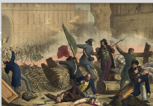
Una delle cinque giornate di Milano 1848.