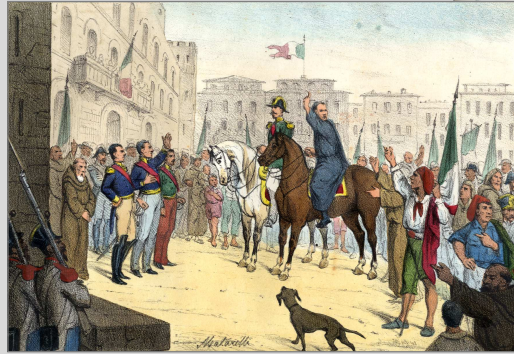
Rivoluzione del 1820 a Napoli. L'abate Menghini e il general Pepe alla testa dei Carbonari.