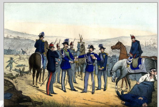
- Prendi, difendila. - O padre, ti giuro di essere il primo soldato per l'indipendenza d'Italia.