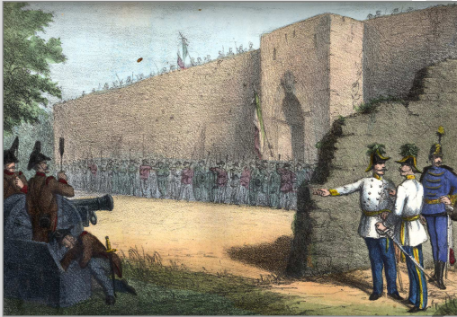
Battaglia di Rimini del 25. marzo 1831.