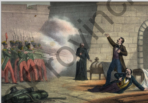
Fucilazione dei fratelli Bandiera.