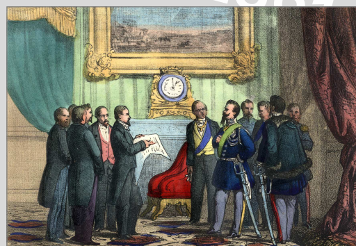
Vittorio Emanuele che riceve la Deputazione con il plebiscito dei Toscani.