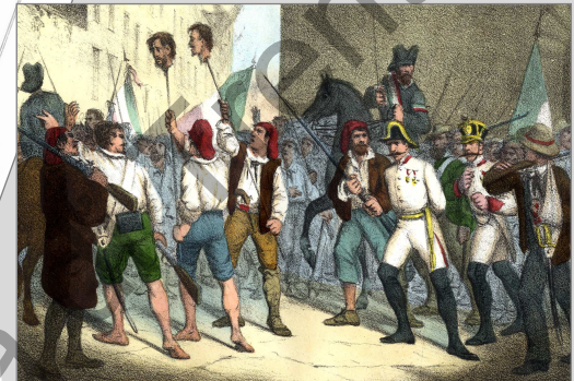
... ed avuti in mano due principi della città avversari al partito, porta le lor teste in trionfo.